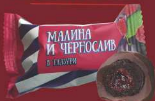
«МАЛИНА И ЧЕРНОСЛИВ»