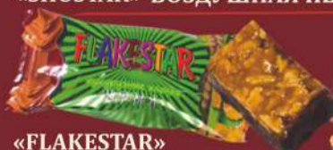
«FLAKESTAR» КУКУРУЗНЫЕ ХЛОПЬЯ