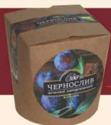
«ЧЕРНОСЛИВ ЦЕЛЬНЫЙ» БЕЗ ФАНТИКА