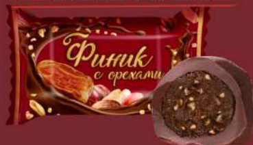
«ФИНИК С ОРЕХАМИ»