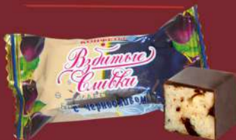
«ВЗБИТЫЕ СЛИВКИ» С ЧЕРНОСЛИВОМ