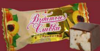
«ВЗБИТЫЕ СЛИВКИ» С АБРИКОСОМ