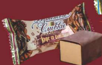
«КОФЕ СО СЛИВКАМИ»

СРОК ГОДНОСТИ: 4 МЕС. ВЕС: 1,0/2,0/3,0 КГ УПАКОВКА: ГОФРОКОРОБ