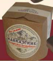
«КАВКАЗСКИЕ» БЕЗ ФАНТИКА

СРОК ГОДНОСТИ: 4 МЕС. ВЕС: 4,0 КГ В ГОФРОКОРОБЕ