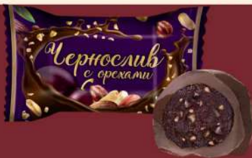
«ЧЕРНОСЛИВ С ОРЕХАМИ»