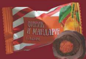
«ФИНИК И МАНДАРИН»