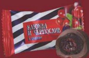
«КЛЮКВА И ЧЕРНОСЛИВ»