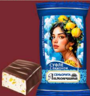
«СЕНЬОРИТА ЛИМОНЧИТА» СУФЛЕ С ЛИМОНОМ