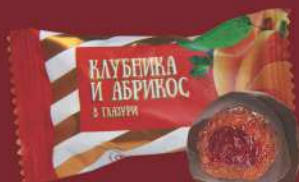
«КЛУБНИКА И АБРИКОС»