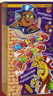
НАБОР КОНФЕТ «HRUSTAR» И «SHUSTAR»