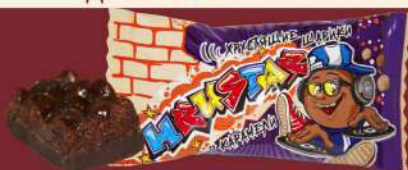
«HRUSTAR» ХРУСТЯЩИЕ ШАРИКИ