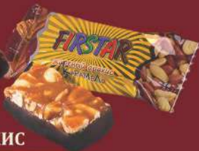
«FIRSTAR» ЖАРЕННЫЙ АРАХИС