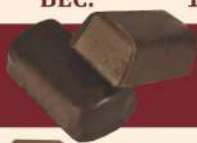
«КАВКАЗСКИЕ» БЕЗ ФАНТИКА

СРОК ГОДНОСТИ: 8 МЕС. ВЕС: 1,0/2,5/3,5 КГ В ГОФРОКОРОБЕ