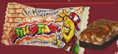
«SHUSTAR» ВОЗДУШНАЯ ПШЕНИЦА