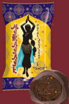
«МУТЛУЛУК» (ФИНИК И ЦУКАТЫ АПЕЛЬСИНА)