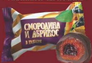
«СМОРОДИНА И АБРИКОС»